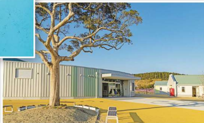
あぐりの丘のあぐりドーム