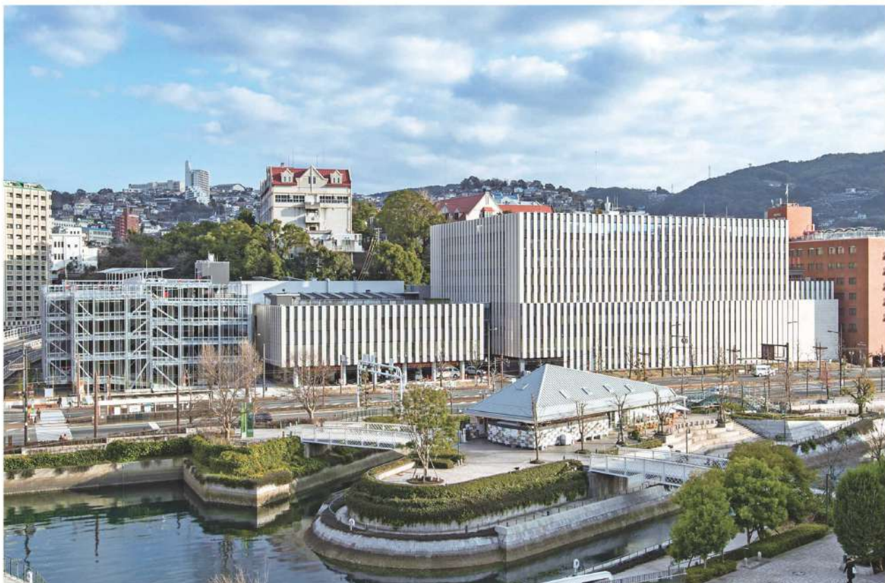
長崎みなとメディカルセンター

独法や市職員に任せるのではなく、 設置責任者である市長において、 しっかりと経営状況の推移をチェックするとともに、 今後のみなとメディカルセンターの在り方について、考える必要に迫られてる中、 真剣に検討するよう要望致しました。