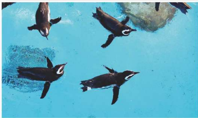
長崎ペンギン水族館