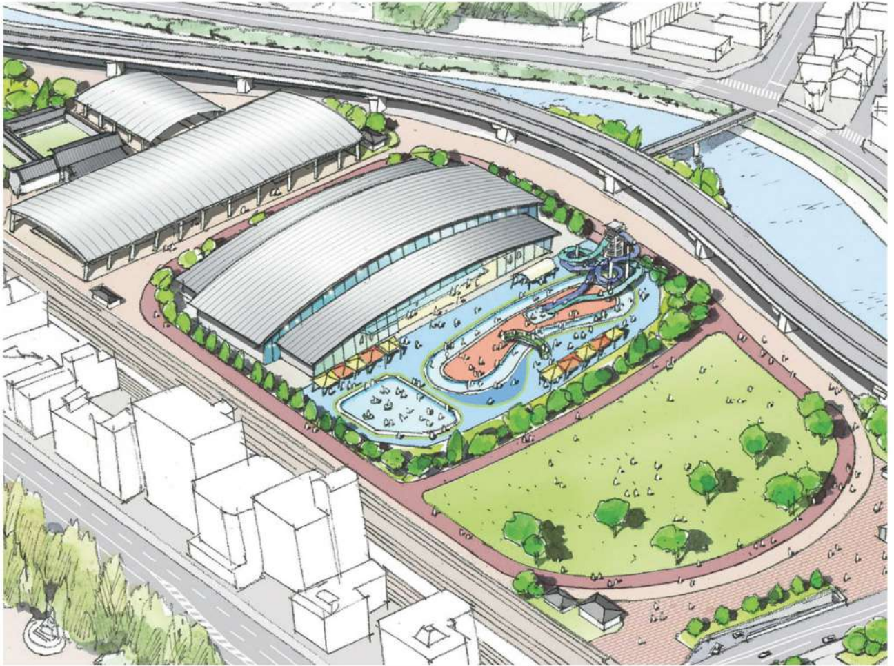
※イメージ図（松山町の旧陸上競技場へ移転する市民プール）